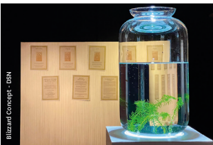
Bizard Concept - DSN