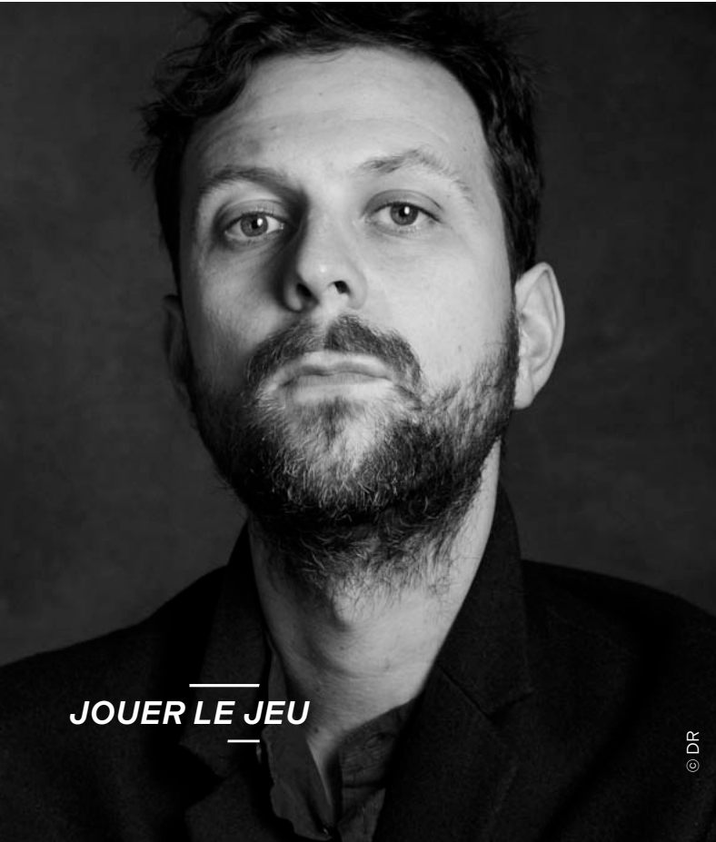
JOUER LE JEU