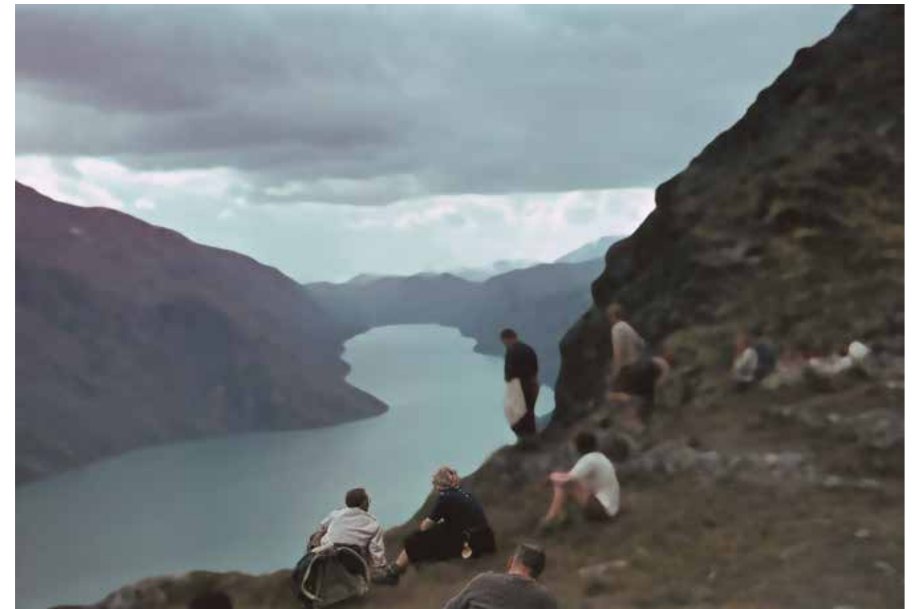
Ebbe Stub Wittrup, "Presumed Reality # 4", 2007.

Les scènes d'excursions en groupe dans les paysages de montagne en Norvège proviennent de diapositives datant des années 1950 et qu'Ebbe Stub Wittrup a trouvées sur des marchés aux puces. Il les a agrandies et retravaillées de manière à brouiller la perception de la réalité, en inversant notamment la mise en point.