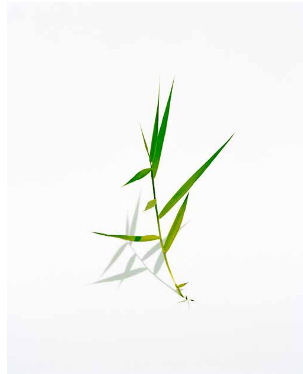
Lotte Fløe Christensen, "Isolated (plants) # 7", 2011.

L'artiste développe une production d'images étroitement liées à l'observation méthodique d'un monde végétal : portraits de plantes endémiques photographiées in situ, devant un fond de papier blanc. Un travail inspiré entre autres d'un célèbre atlas botanique entrepris au XVIII e siècle : « Flora Danica ».