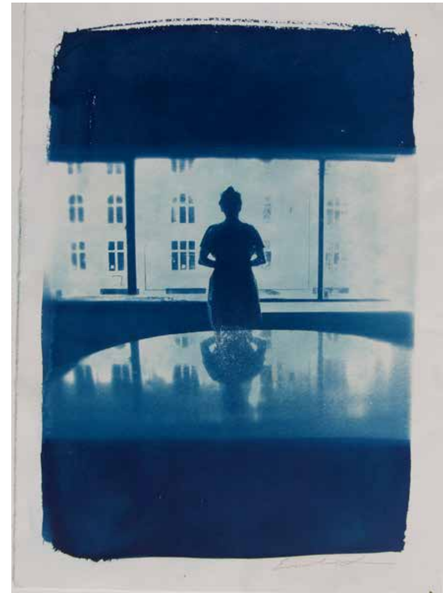
Emilie Lundstrøm, « The View » (cyanotype sur papier), Copenhague, 2019.

Avec « Imprécisions », l'artiste revisite le procédé ancien du cyanotype pour créer des impressions monochromes qui intègrent les incertitudes liées à ce type de production d'images. Les sujets, des paysages et des autoportraits, sont imprimés sur papier et à la surface de diverses pierres. Celles-ci créent un dialogue avec l'environnement minéral du logis abbatial et de l'abbaye et soulignent la manière dont les images sont indissociables du matériau sur lequel elles sont imprimées.