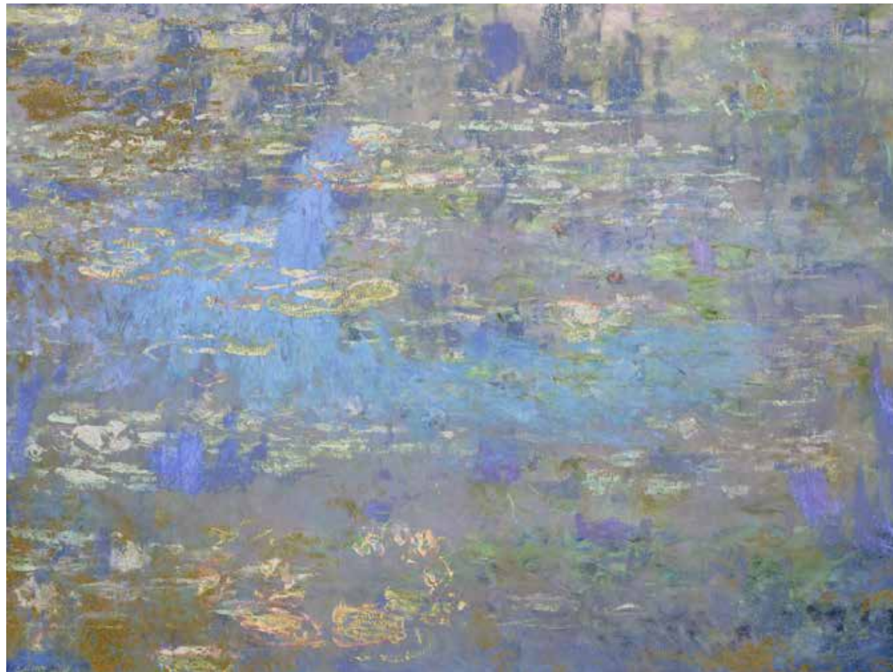
Jeppe Lange, "Depiction of the Light" (video still), 2021.

« Dans cette œuvre, des centaines de tableaux impressionnistes se dissolvent pour créer un film d'animation aux effets hypnotiques. L'œuvre regarde le monde comme des motifs constitués de couleurs pures et de coups de pinceau. Elle remet en question la réalité photographique et offre un regard libéré de toute catégorisation. » J.L.