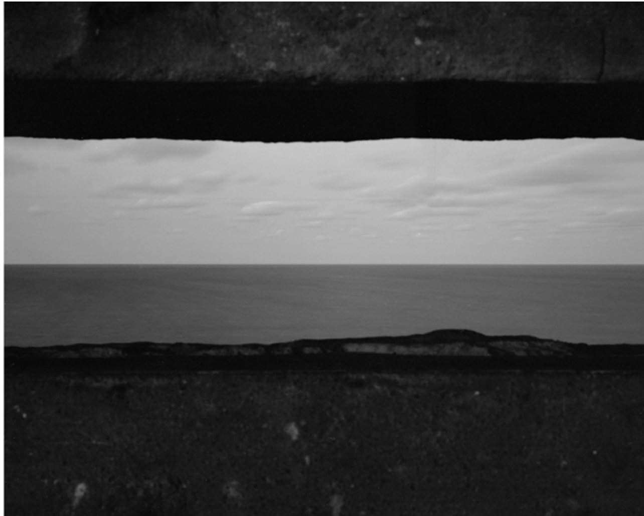
Peter Funch, "Possibilities of the future. Realities from the past", Bulbjerg, Danemark, 2019.

Il compose, depuis l'intérieur de bunkers et en suivant un protocole photographique minutieux, des vues de l'horizon marin en noir et blanc ; elles s'inscrivent dans le cadre d'un projet en cours sur le Mur de l'Atlantique et qui l'emmène de la Norvège à l'Espagne. Ce projet est enrichi de prises de vue qu'il a réalisées sur les côtes de Normandie à l'occasion de cette exposition.