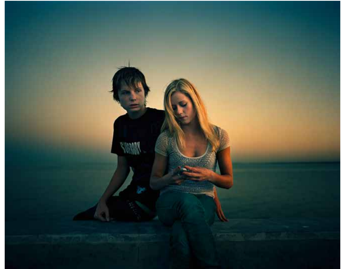
Joakim Eskildsen, "Skagen XIII", 2008.

L'exposition présente une série réalisée à Skagen, un territoire situé à l'extrême nord du Danemark et connu pour la qualité particulière de la lumière qui éclaire le paysage en bord de mer. Une lumière et des couleurs qui ont inspiré de nombreux peintres dont certains ont noué des liens avec les impressionnistes français de leur époque.