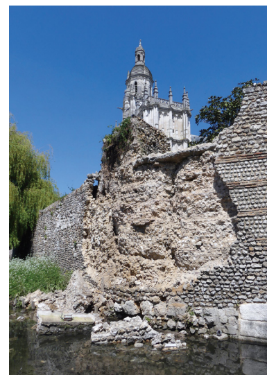
L'angle du rempart, à l'emplacement du Miroir d'eau, après effondrement partiel des maçonneries, Évreux (27)