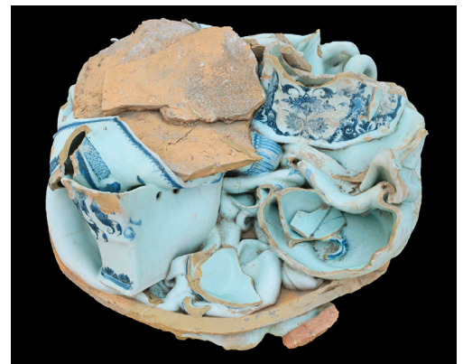
Mouton de la faïencerie Poterat de Rouen (76)