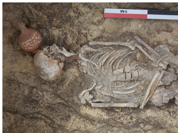
Sépulture n°1024 de la nécropole du Grand-Clos à Bretteville-sur-Laize (14)