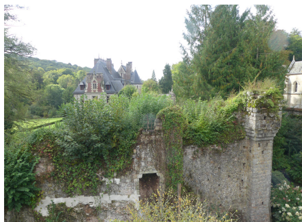
Vue du vieux Château de Clères (76)