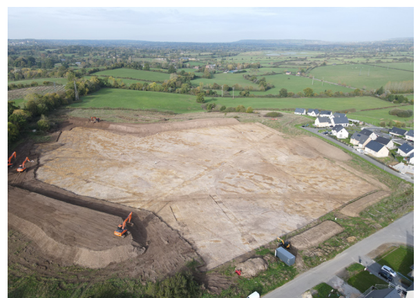
Photo de la zone de fouille du site de Mont-Fiquet, Pont-L'Évêque (14)