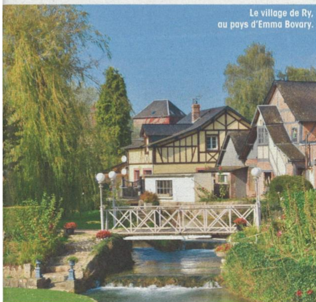
Le village de Ry, au pays d'Emma Bovary.