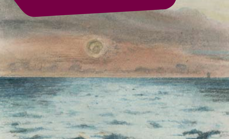
La Mer au coucher du soleil pastel Paris, musée du Louvre, D.A.G.

« Le temps est tout à fait beau : nous avons été à Saint-Pierre, à travers la vallée ». « Nous sommes descendus à la mer par un chemin à droite, que je ne connaissais pas. C'est la plus belle pelouse en pente douce que l'on puisse imaginer. L'étendue de mer que l'œil embrasse de la hauteur est des plus considérables. Cette grande ligne bleue, verte, rose, de cette couleur indéfinissable qui est celle de la vaste mer, me transporte toujours. Le bruit intermittent qui arrive déjà de loin et l'odeur saline enivrent véritablement... » « J'ai beaucoup étudié la mer, qui était toujours la même et toujours belle. »