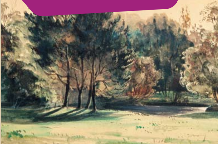
Vue du parc de Valmont Collection particulière

« ... Dormi dans ma chambre, puis fait un tour de parc à la nuit tombante. Ce parc et ces arbres gigantesques ont pris un aspect qui est presque lugubre ; mais en vérité, si l'on pouvait, en peinture, rendre de pareils effets, ce serait ce que j'ai vu en paysage de plus sublime. Je ne peux rien comparer à cela. Cette forêt de colonnes formées par les sapins, le vieux noyer en montant, etc ».