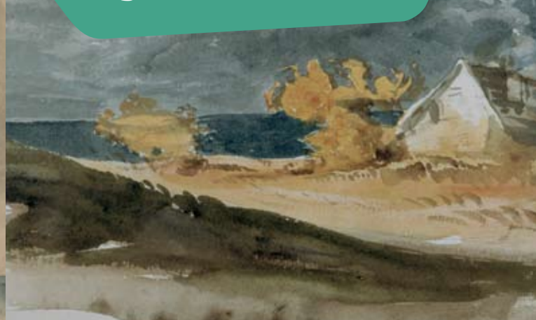
Chaumière dans un paysage de Normandie aquarelle ; mine de plomb - Paris, musée du Louvre, D.A.G.

« Revu, en passant, Angerville, où je suis venu, il y a tant d'années, avec ma bonne mère, ma sœur, mon neveu, le cousin, tous disparus ! Cette petite maison est toujours là, comme la mer que l'on voit de là, et qui y sera encore à son tour, quand la maison aura disparu. »