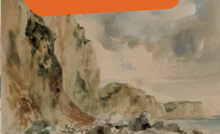
Des falaises en Normandie aquarelle Paris, musée du Louvre, D.A.G.

« Passé devant le château de Sassetot. Environs magnifiques ; la descente pour aller à la mer. Effet de ces grands bouquets de hêtres. Arrivé à la mer par une ruelle étroite ; on la découvre tout d'un coup au bout du chemin. Mer basse. J'ai été sur les rochers et ramassé deux des coquillages qu'on y trouve collés ; j'ai essayé de les manger. Chair dure, sauf un je ne sais quoi de jaune qui a un goût agréable de moule. Fait plusieurs croquis ».