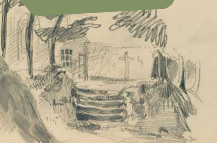
Vue sur une petite église à travers des arbres Paris, musée du Louvre, D.A.G.

« Revenus par Thérouldeville, et visité la petite église. Touché extrêmement de cet endroit : le presbytère est charmant. Je parlais à Bornot de la condition tranquille du curé d'un lieu pareil... ».