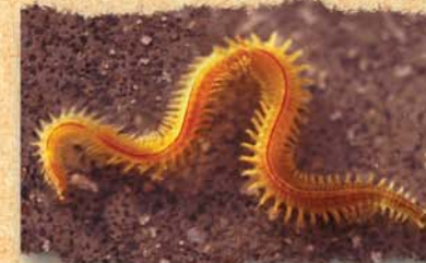
▲ le ver néreis