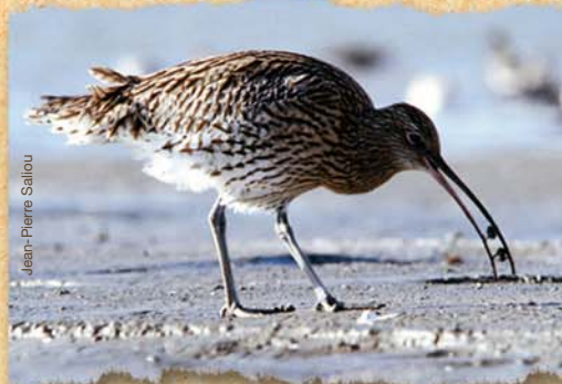
◀ le courlis cendré

Le tadorne raffole par exemple des petits mollusques nommés hydrobies présents à la surface de la vase. Quand au courlis cendré, il attrape les vers de vase avec son long bec courbé vers le bas. A marée haute ce sont les jeunes poissons, crabes et autres crustacés qui viennent se nourrir à leur tour de vers, de coquillages, de plancton animal et végétal.