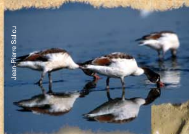
◀ le tadorne de Belon

Chaque oiseau possède un bec adapté à la capture de différentes proies.