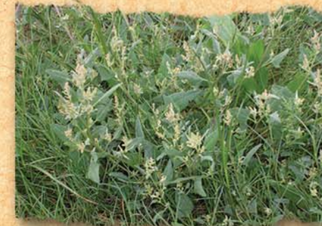
▼ l'arroche hastée