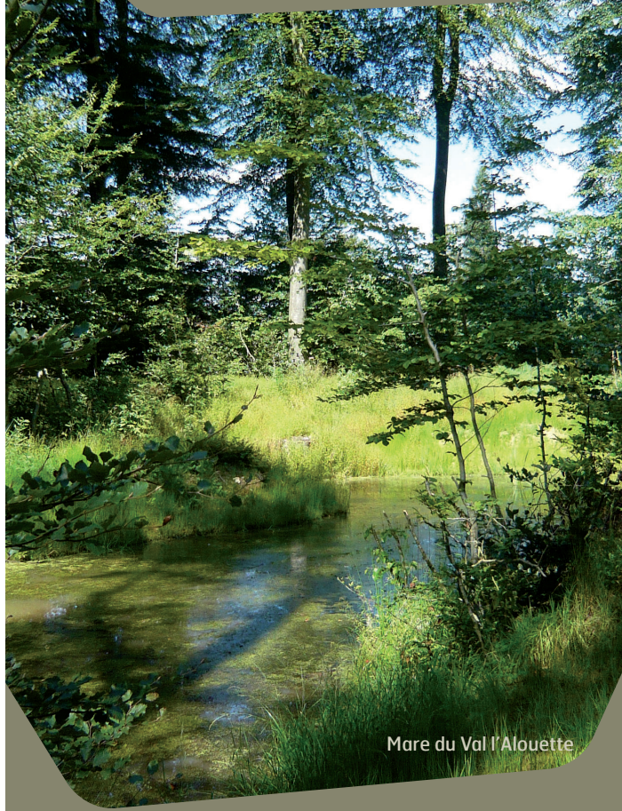
Mare du Val l'Alouette