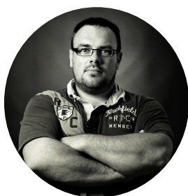
Thomas BOIVIN Photographe et vidéaste