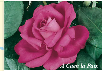
A Caen la Paix