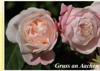
Gruss an Aachen