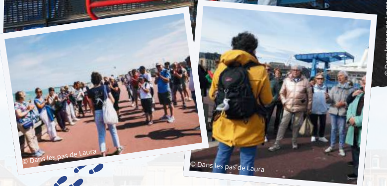
© Dans les pas de Laura