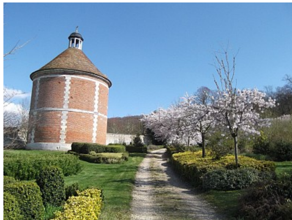
Métropole Rouen Normandie

Quittez le halage au niveau de la chaumière en suivant un petit sentier puis tournez à droite dans le Port d'Yville. Tournez à gauche sur la rue du Clos des Paradis. 400 mètres plus loin, vous découvrez le colombier puis le château d'Yville. Tournez une première fois à droite sur la rue du Vivier et une deuxième fois rue de l'église. Au niveau de l'église tournez à gauche puis à droite quelques pas plus loin. La ruelle vous ramène sur la route principale, prenez à gauche pour retrouver le parking de la mairie.