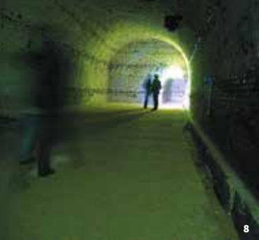
8. Supposé « Hôpital militaire allemand »