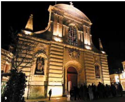
9. Abbatale de la Sainte-Trinité