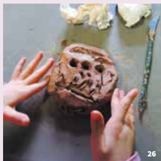
26. Atelier Rencontre avec les monstres