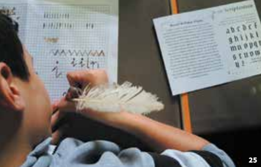
25. Atelier Écriture à la plume d'oie