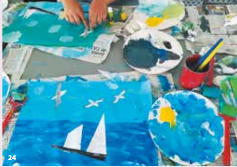
23. Atelier Sur le pont, moussillons !