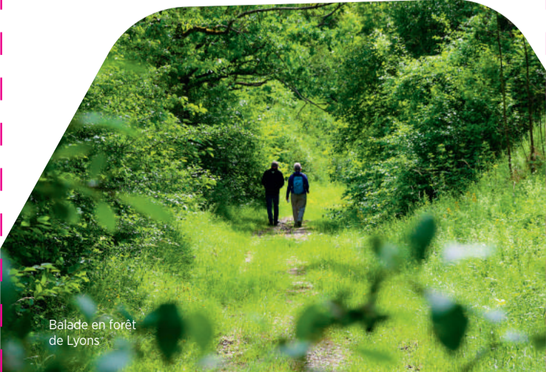
Balade en forêt de Lyons

Belle petite boucle dans le plus grand massif forestier de Normandie où vous aurez sûrement la chance de rencontrer des animaux. Avant la balade, vérifiez les périodes de chasse sur le site de l'ONF. Possibilité de faire ce circuit à cheval à partir du parking du centre équestre : L'Etrier du Landel.