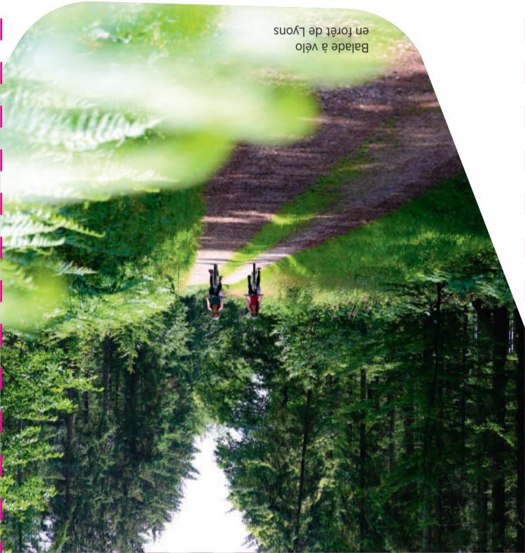
Balade à vélo en forêt de Lyons

Petit parcours agréable par son charme paysager et son village qui a conservé de très belles mares et des sentes à paniers.