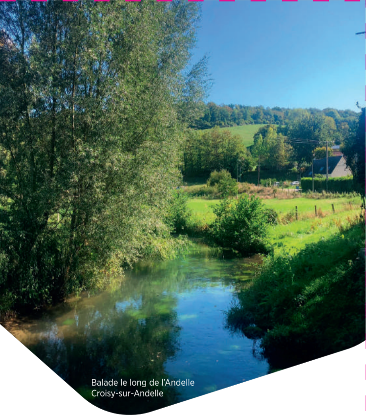
Balade le long de l'Andelle Croisy-sur-Andelle