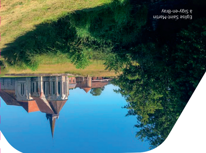
Eglise Saint-Martin à Sigy-en-Bray

Petite boucle qui allie découverte du patrimoine bâti et du paysage Brayon. Ce parcours offre un superbe panorama sur le village de Sigy-en-Bray depuis les Monts de Sigy, site naturel.